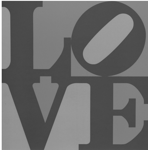
Robert Rauschenberg, '1967', 'Lobdeck'